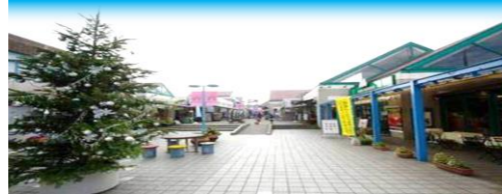
あすみが丘パーズモール